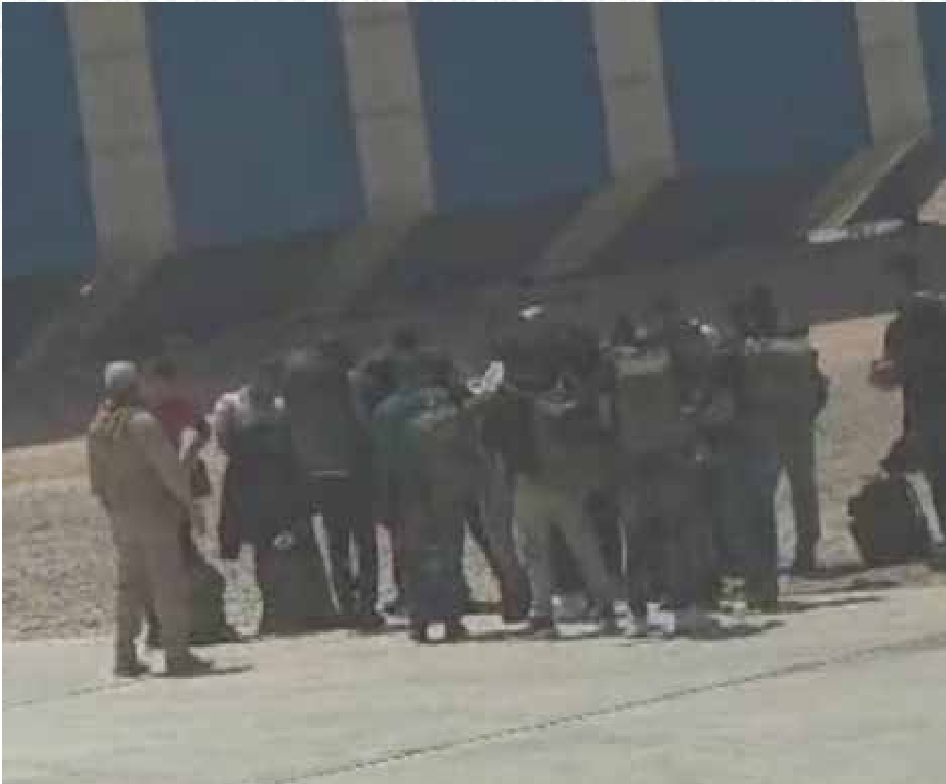
A video shows the arrival of Colombian soldiers at the port of Bosaso