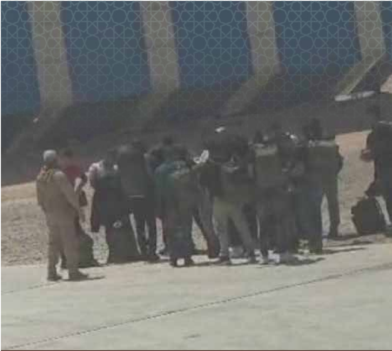
صور تظهر وصول جنود كولومبيين الي ميناء بوصاصو