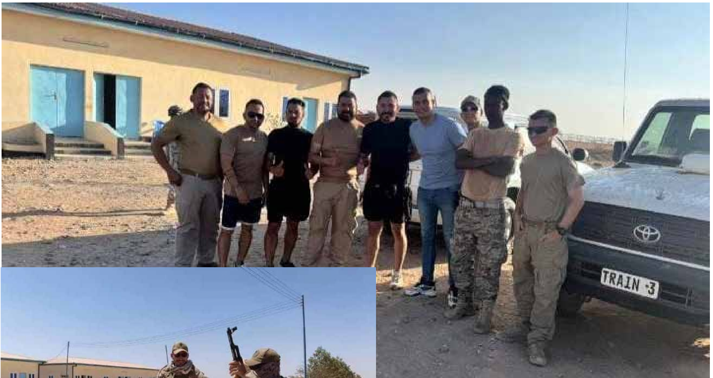
مرتزة كولومبيون في أكاديمية الجيش *