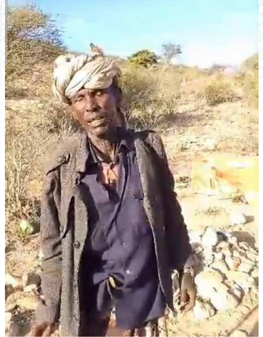
A Citizen on the outskirts of bossaso talks about targeting civilian marches