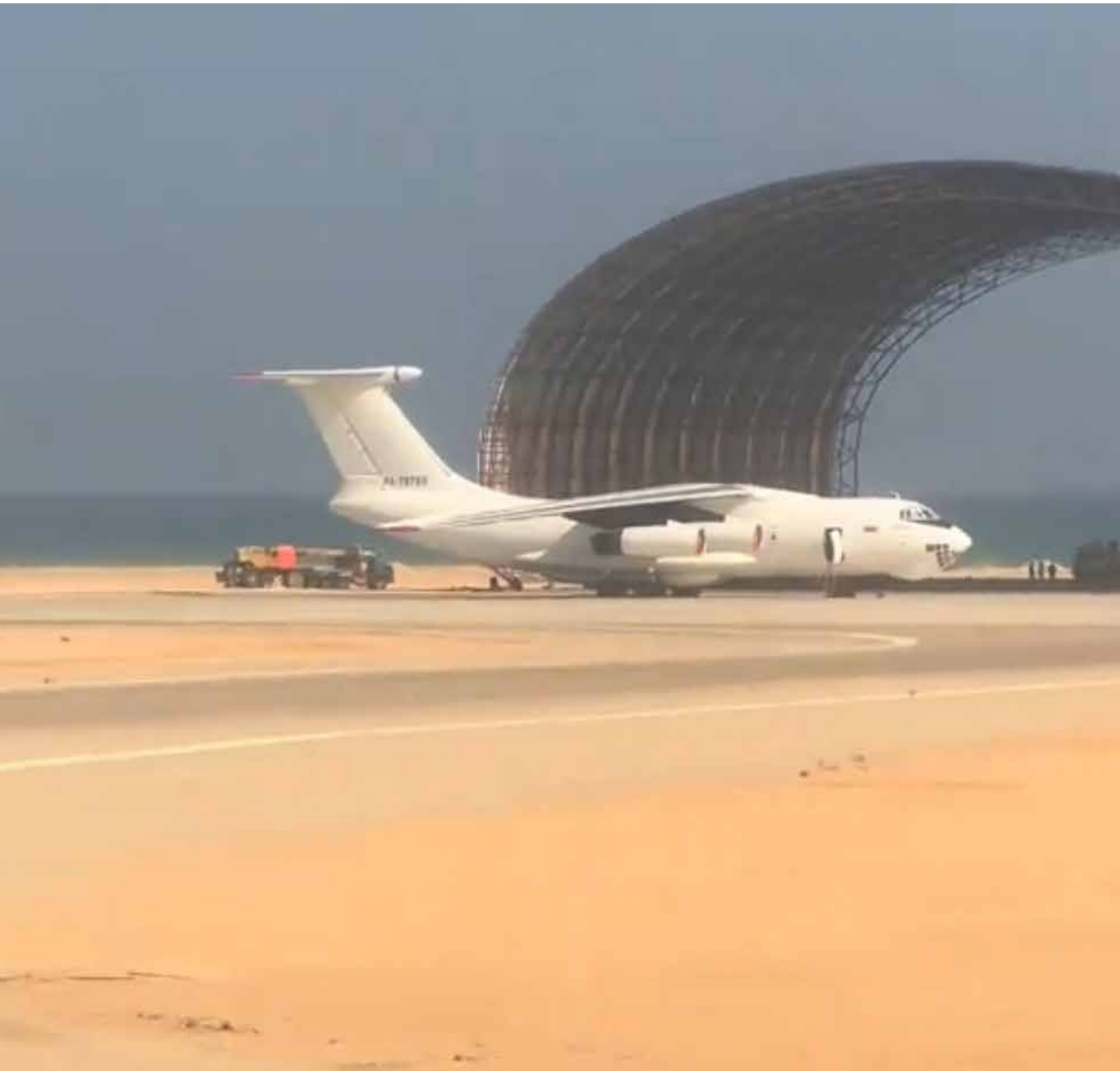
إستخدمت الإمارات هذه الطائرة الروسية منذ أكثر من عام في عمليات شحن عسكرية من دبي إلى بوصاصو ومنها إلى السودان ، وتقوم بخمس أو ست رحلات يومية من قاعدة بوصاصو إلى السودان ، وقبل ساعة قام السكان المحليون بتصوير هذه الطائرة وأرسلوا لي الفيديو .