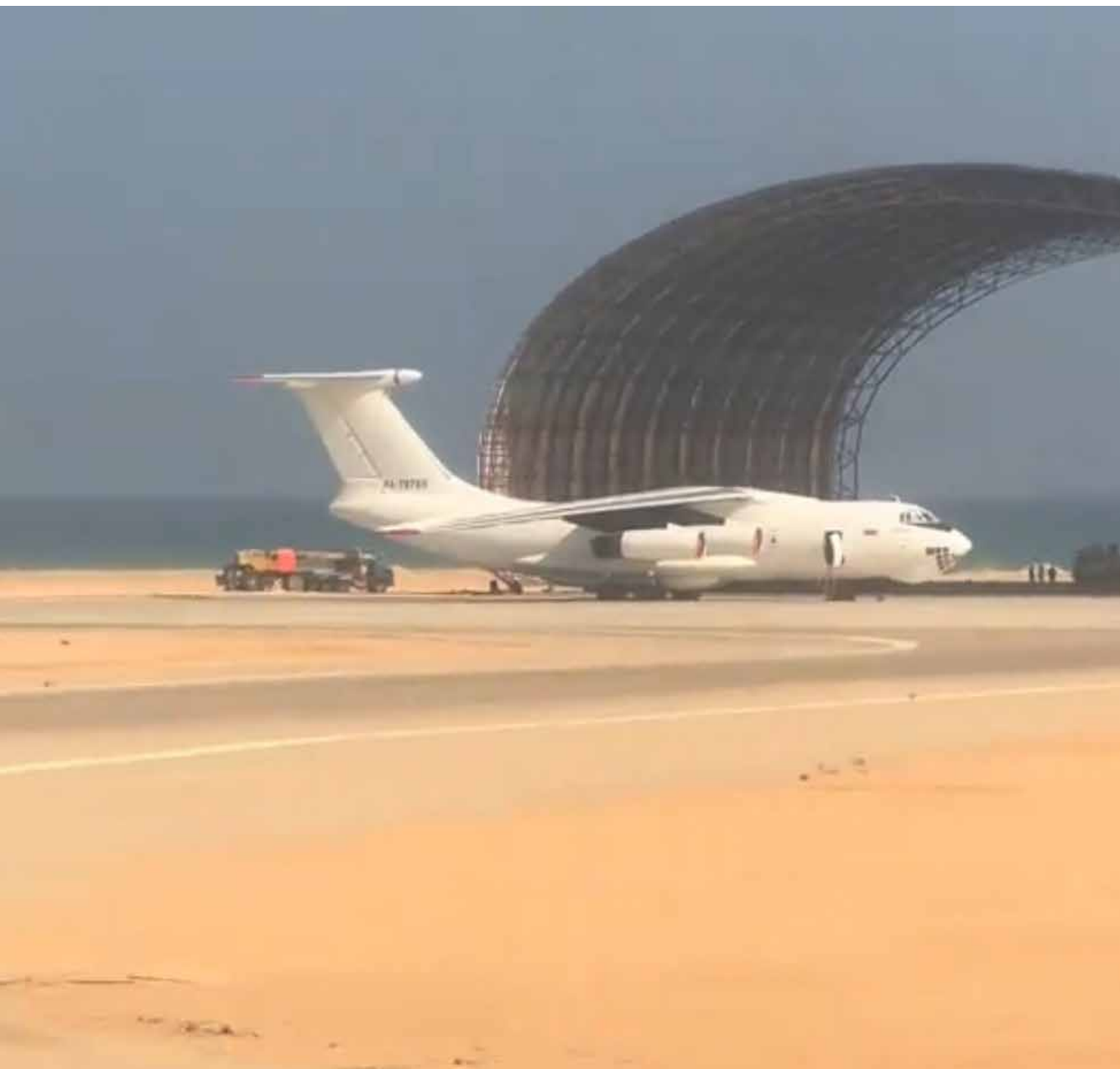
This Russian plane was used by the UAE more than a year ago for military cargo operations from Dubai to bossuo and from bossao to Sudan, and it is making five or six daily flights from bossao to Sudan, and an hour ago the locals filmed this plane and sent me the video .